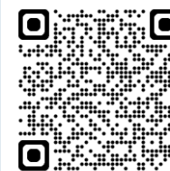
Gjennomføring av undersøkelsen